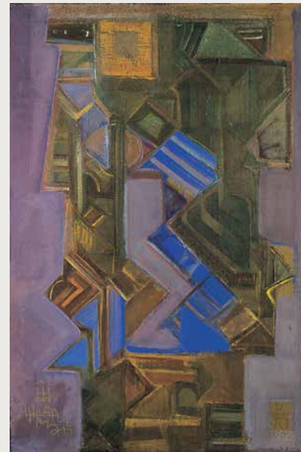
Знакомство. 1991 Дерево, холст, левкас, темпера. 75 x 50 см Русский музей