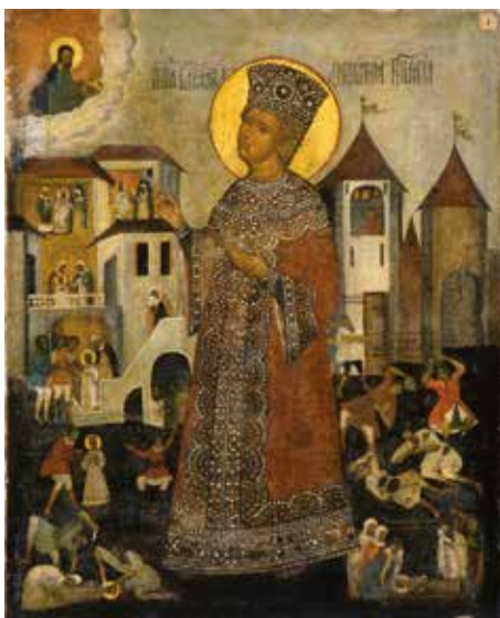
Неизвестный художник Царевич Дмитрий. 1-я половина XVIII века Холст, масло. 107 x 86

Весьма обширна и значительна галерея портретов русских царей, императоров и императриц, а также других членов династии Романовых. В ней «оживают» лица тех, кто в течение нескольких столетий правил Россией. Многие портреты, написанные известными западноевропейскими мастерами, работавшими в России, свидетельствуют об интернациональной художественной атмосфере, существовавшей при императорском дворе.