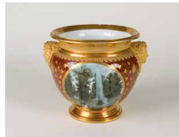
Предмет «Гурьевского» сервиза. 1809-1816. Императорский фарфоровый завод Фарфор, лепка, роспись надглазурная, золочение, цировка