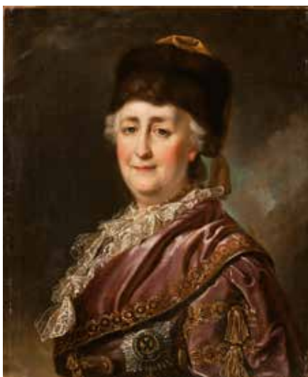
Неизвестный художник Портрет Екатерины Второй в дорожном костюме. 1780-е Холст, масло. 63 x 52

Д инастия Романовых (1613 – 1917), правившая в России более трех столетий, принадлежала к числу самых блестящих монарших домов Европы. Главной исторической миссией Романовых можно было бы назвать модернизацию средневекового Московского царства и его превращение в огромную Российскую империю, ставшую одним из главных субъектов на арене европейской и мировой политики. За это время на русском троне сменились восемнадцать царей, императоров и императриц. Не все они были одинаково способны управлять государством, и не всем им сопутствовала удача. Жизнь царского двора являла собой «шекспировское» действо, где триумфы и достижения перемежались с заговорами и политическими убийствами. Но эта насыщенность драматическими событиями характерна для русской истории, как и для европейской.