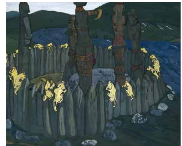
Идолы. 1901 Эскиз. Картон, гуашь 49x58 см Государственный Русский музей, Санкт-Петербург

В состав выставки в Малаге вошли произведения Николая Рериха из собрания Русского музея. Значительная часть показываемых полотен подарены музею самим художником или его сыновьями, Юрием и Святославом.