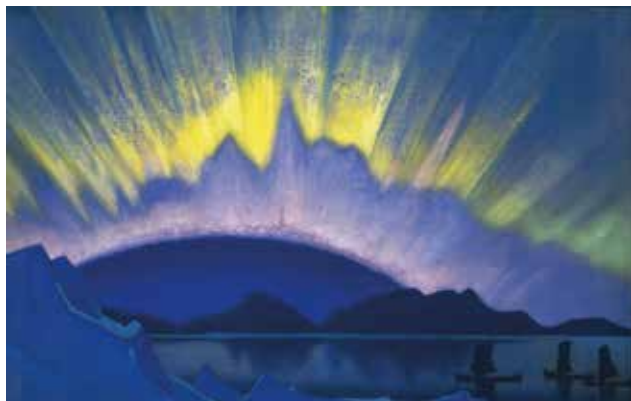
Полуночное. 1940 Холст, темпера 76x123 см Государственный Русский музей, Санкт-Петербург

Поиски следов движения народов с Востока на Запад, доказательства огромной цивилизационной роли Индии, Китая, Сибири составляли главную цель жизни Рериха в 1920–1940-е годы. Эти десятилетия он в основном прожил в Индии, где и умер в 1947 году. Рерих организовал несколько экспедиций, с которыми проходил сотни километров труднейшего пути, чтобы встретиться с религиозными деятелями и простыми людьми, живущими далеко от