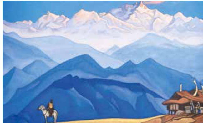
«Помни!». 1947 Холст, темпера 92x153 см Государственный Русский музей, Санкт-Петербург

городов. Из каждой экспедиции Рерих привозил археологические находки, записи разговоров с ламами, истории, рассказанные жителями монастырей и селений.