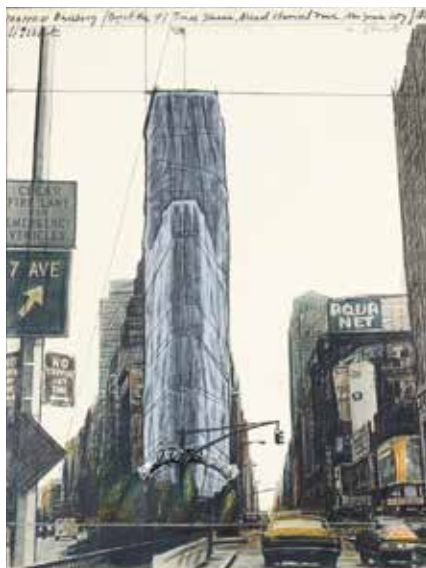
Christo (Christo Vladimirov Javacheff) The Flatiron in New York City, 1985