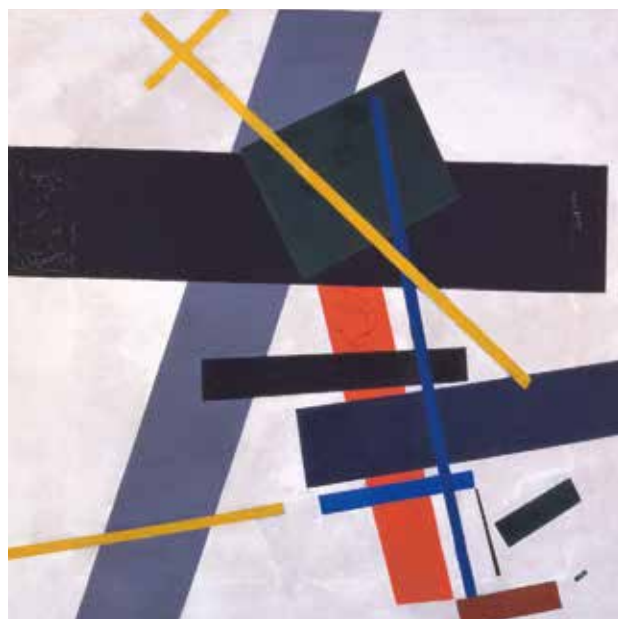
Супрематизм. 1915-1916 Холст, масло. 80,5 x 81 см. Русский музей

Казимир Малевич – один из самых известных художников XX века. Созданное им в середине 1910-х годов направление беспредметного искусства, названное самим Малевичем «супрематизм» (от латинского supremus – высший), до сих пор оказывает огромное влияние на живописцев, архитекторов, дизайнеров разных стран.