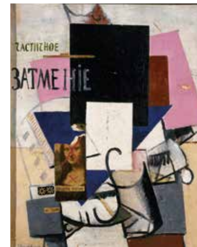
Композиция с Джокондой («Частичное знамение»). 1914. Холст, масло, графитный карандаш, коллаж. 62,5 x 49,3 см. Русский музей

В самые последние годы жизни Малевич много размышлял над проблемой оформления Домов и Дворцов культуры, заменивших в советское время церкви. Также он работал над проектом так называемого Социалистического города. В нем должны были жить люди разных сословий. Картины и этюды, созданные Малевичем около 1933 года, скорее всего связаны именно с проектом «Социалистический город» или «Город художников», как иногда называют этот поздний проект (не был реализован). Судя по «Портрету жены», «Автопортрету» и другим картинам этого цикла, Малевич снова уходит от советского реализма. Используя ренессансную стилистику, он создает возвышенные, обобщенные образы своих современников. Даже свой автопортрет на обороте холста Малевич гордо называет «Художник», подтверждая неперсонифицированный, универсальный образ.