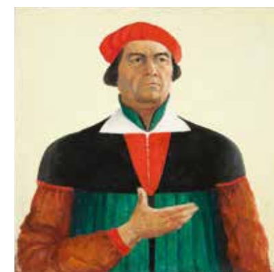
Автопортрет. («Художник»). 1933 Холст, масло. 73 x 66 см. Русский музей