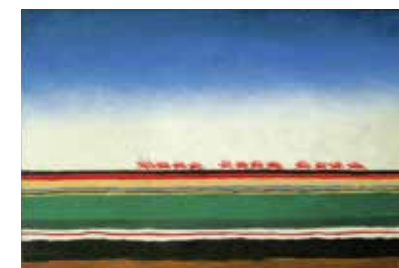
Красная конница. Около 1932 Холст, масло. 91 x 140 см. Русский музей