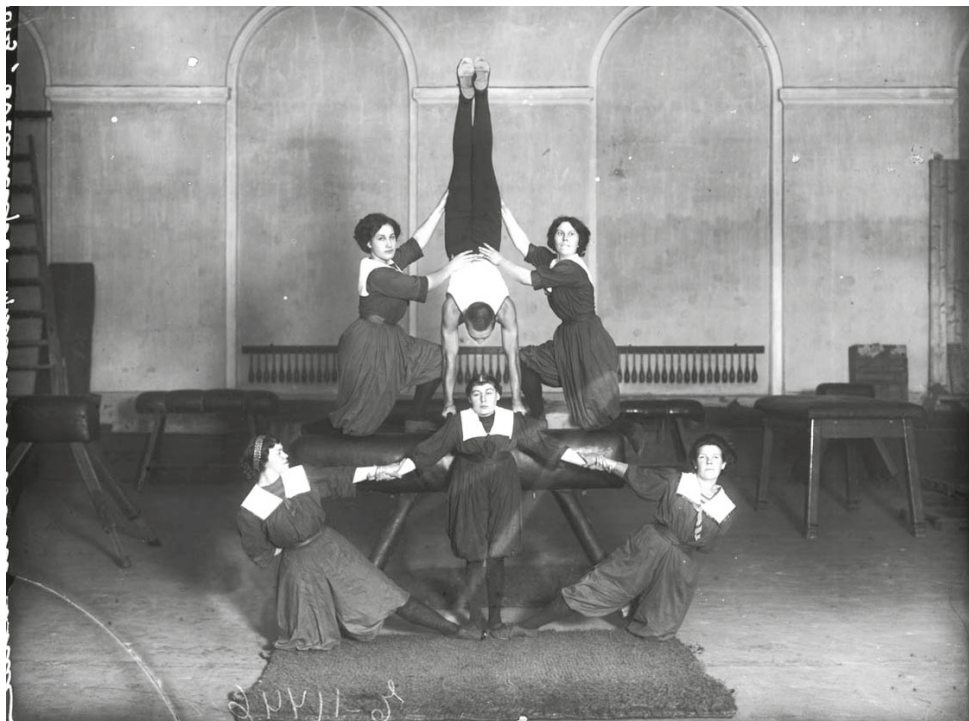
Карл Булла. Общество физической культуры "Богатырь". Показательные выступления гимнастов. Санкт-Петербург, 1912