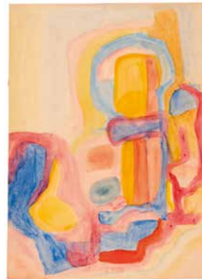
МАРИЯ ЭНДЕР Композиция. 1920 Бумага, акварель. 40,8 x 30 На обороте надпись: vñ 4254 см Коллекция Кристины Гмуржинской