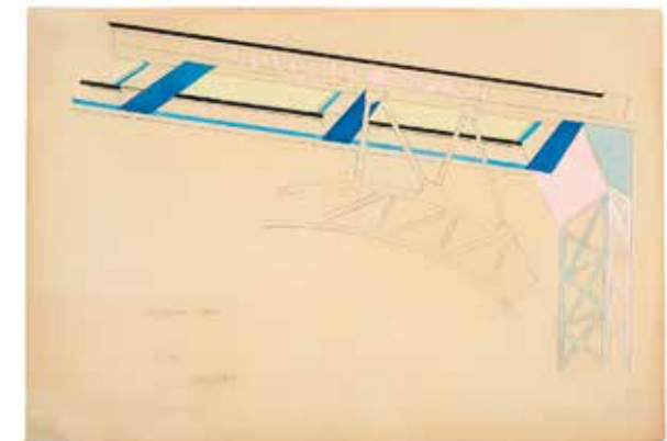
АННА ЛЕПОРСКАЯ КАЗИМИР МАЛЕВИЧ Потолок арки железного зала в Государственном Народном доме (Госнардом). 1931 Бумага, карандаш, гуашь. 44 x 63,5 см Слева внизу надпись, дата и подпись: Потолок арки 31 год Лепорская На обороте подпись, название и дата: Лепорская Потолок арки железного зала Госнардома б. гуашь 44 x 63,5 1931 г. Коллекция Кристины Гмуржинской