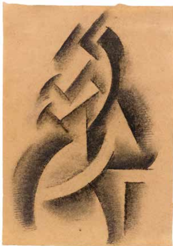
ВЕРА ПЕСТЕЛЬ Конструктивистская композиция. 1921 Бумага, наклеенная на картон, уголь. 21,8 x 15,5 см Дата и надпись на обороте Коллекция Кристины Гмуржинской

На обложке: НАДЕЖДА УДАЛЬЦОВА. Композиция 58 V. 1916. Бумага, гуашь. 26,3 x 17 см. На обороте надпись: 58 V. Коллекция Кристины Гмуржинской