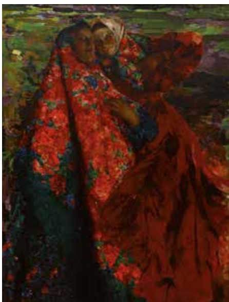
Filipp Maliavin Campesinas 1905