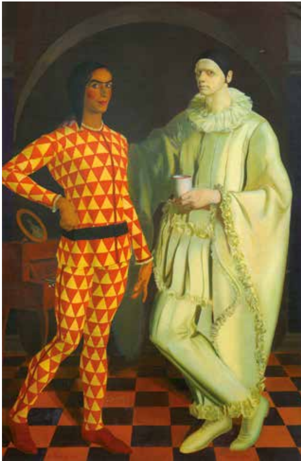
Vasili Shujáiev y Aleksandr Yákovlev Autorretratos (Arlequín y Pierrot) 1914