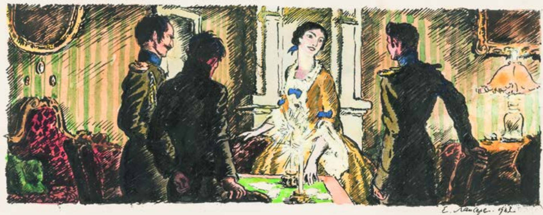
EUGÈNE LANCERAY. Playing Cards in the Drawing Room of the Vorontsovs' House . 1913 Headpiece for chapter III of Leo Tolstoy's story Hadji Murad . Watercolour, Indian ink and gouache on cardboard. 23.2 x 35

Another aspect of the exhibition focuses on illustrations for Tolstoy's novel War and Peace and his story Hadji Murad . The drawings by Dementy Shmarinov (1907–1999) and watercolours by Eugène Lanceray (1875–1946) are the most famous series of illustrations to these pieces. There is one theme that unites these artists' individual readings of Tolstoy's texts – a striving for authenticity. Both Lanceray and Shmarinov found it important and necessary to consult historical sources and travel to the locations of the stories' events, likely no less important than it was for Tolstoy himself. Bearing priceless witness to and preserving the appearance of the bygone era are drawings and lithographs by English traveller John Thomas James (1786–1828), which may have influenced Tolstoy's description of old Moscow, as well as drawings by Prince Grigory Gagarin (1810–1896), studied by Lanceray at the Russian Museum in early 20th century St Petersburg. These unique materials are shown at the exhibition in Málaga.