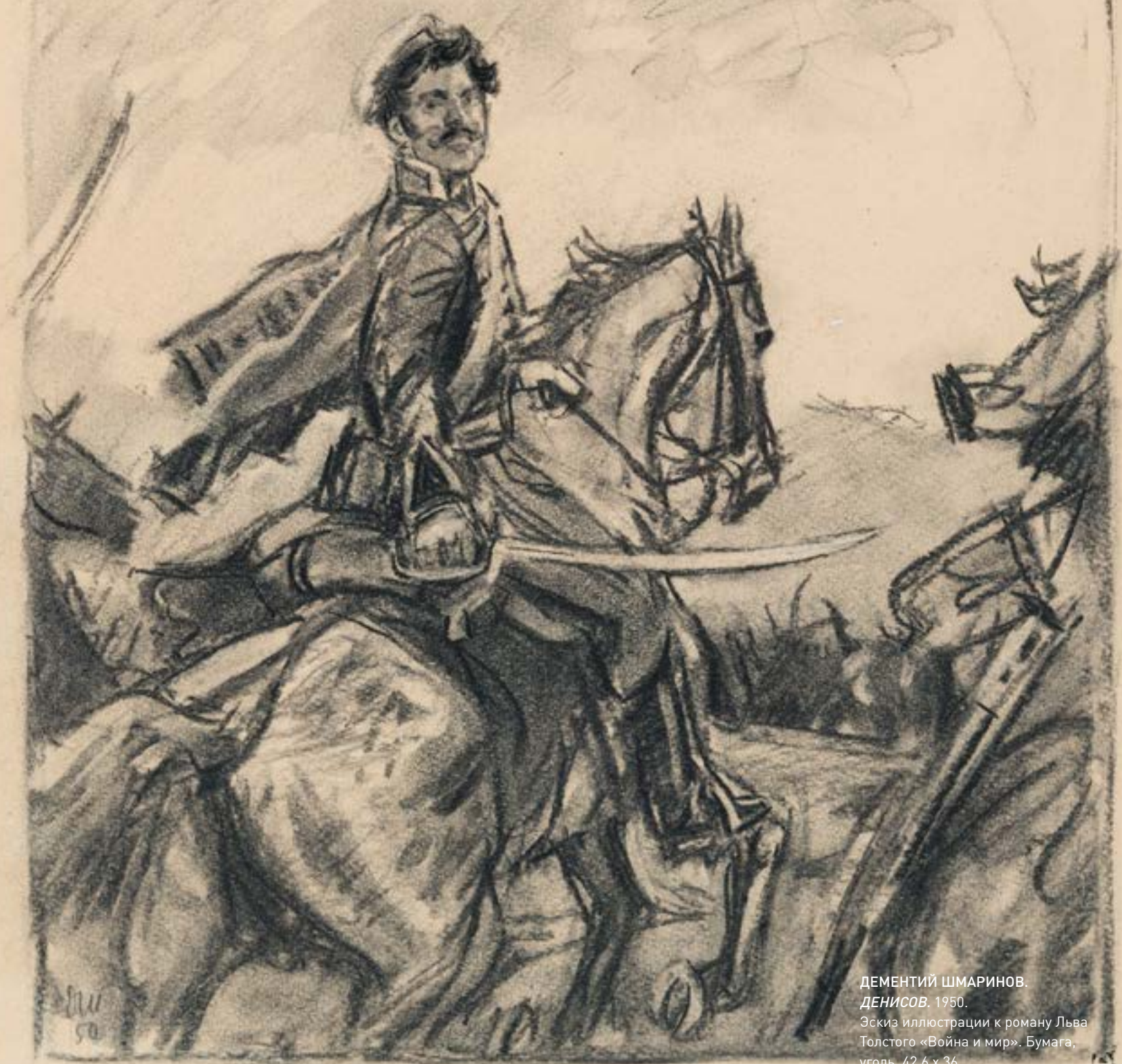
ДЕМЕНТИЙ ШМАРИНОВ. ДЕНИСОВ. 1950. Эскиз иллюстрации к роману Льва Толстого «Война и мир». Бумага, уголь. 42,6 x 36

Небольшая выставка, посвященная Льву Толстому, из собрания Русского музея достаточно многогранна. Здесь – прижизненные портреты писателя – живописные, графические, скульптурные, исполненные мастерами второй половины XIX - начала XX век. Среди них – знаменитые карандашные рисунки Ильи Репина (1844—1930), пастель Леонида Пастернака (1862—1945), скульптуры Паоло Трубецкого (1866—1938), а также безусловно, интересные, но не столь известные работы Наума Арансона (1872/1873—1943), и Ивана Похитонова (1850—1923). Каждый портрет — это еще и особая история взаимоотношений художника и писателя, диалог творцов.