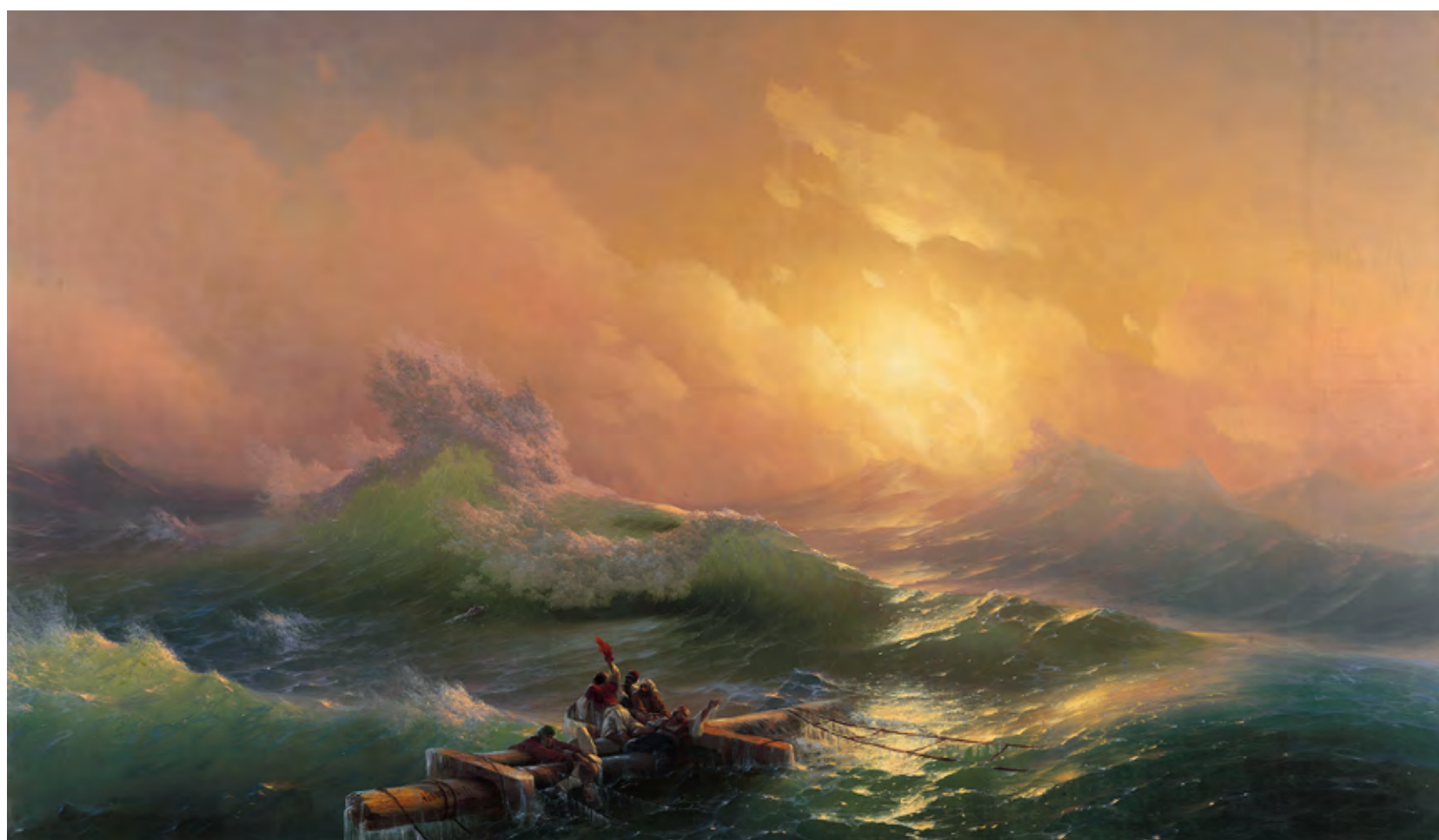
Iván Aivazovsky. La novena ola . 1850