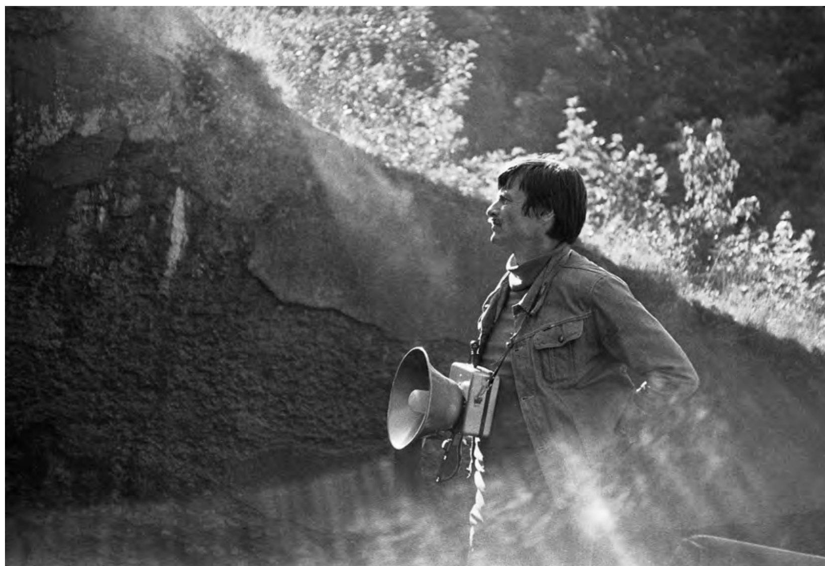
Andrei Tarkovsky. En el rodaje de Stalker , 1978.

Acceso: gratuito con reserva previa hasta completar aforo (40 personas) a través del e-mail info.coleccionmuseoruso@malaga.eu