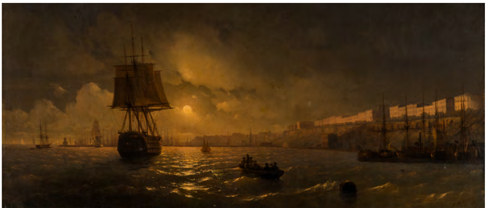
Iván Aivazovsky. Vista de Odesa en una noche de luna , 1846

Más info: educacion.coleccionmuseoruso@malaga.eu