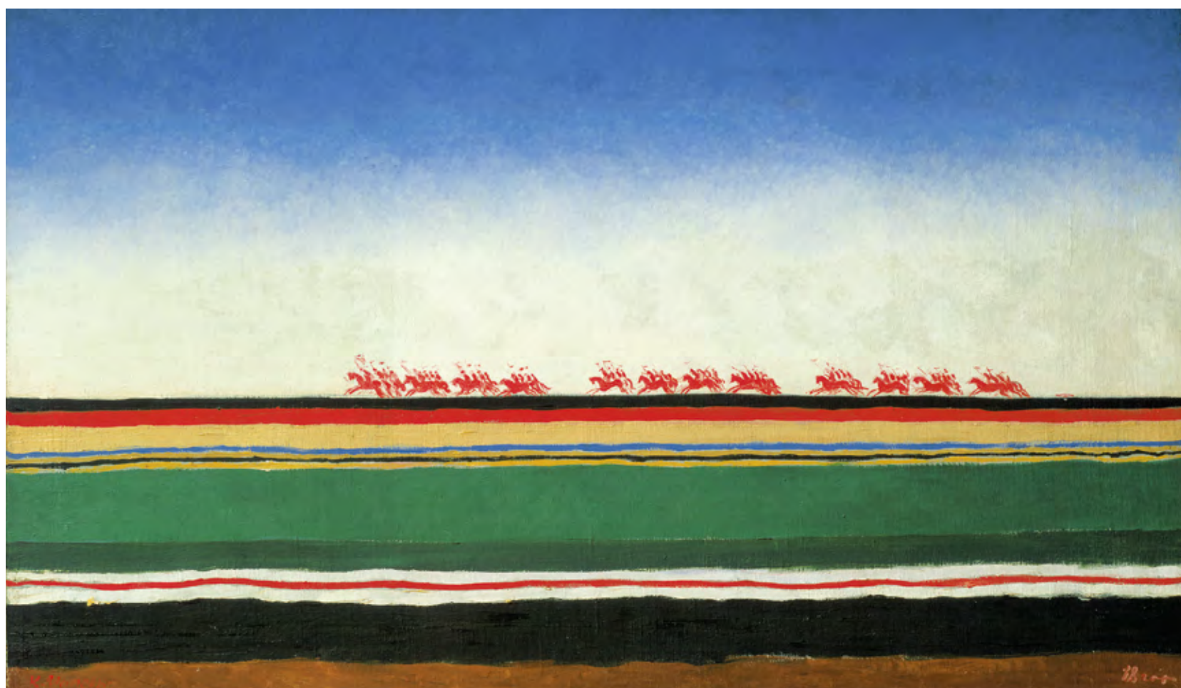
Kazimir Malévich. Caballería Roja c. 1932 © Museo Estatal Ruso San Petersburgo