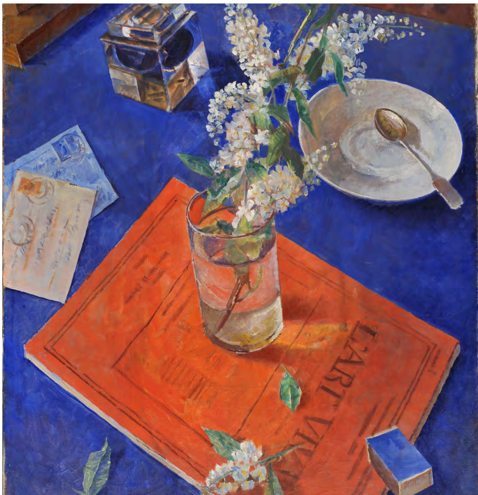
Kuzma Petrov-Vodkin. Rama de cerezo aliso en flor en un vaso , 1932.