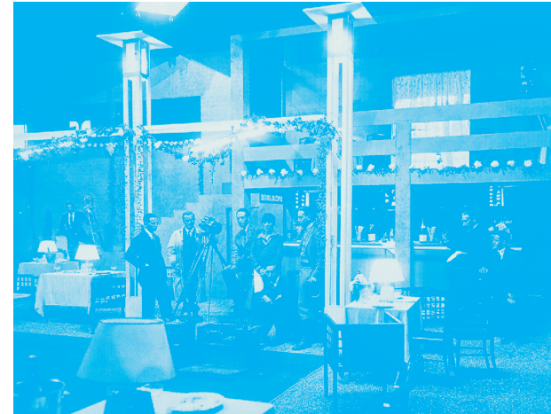
Rodaje del film Le Vertige , dirigido por Marcel L'Herbier en 1926

que deben seguir la senda de genios como los hermanos Sternberg e interpretar a la manera del cartelismo soviético algunas de las películas más emblemáticas de la cinematografía española. Exposición comisariada por Sonia Marpez.